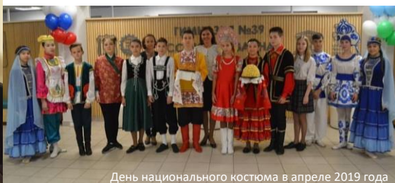
День национального костюма в апреле 2019 года